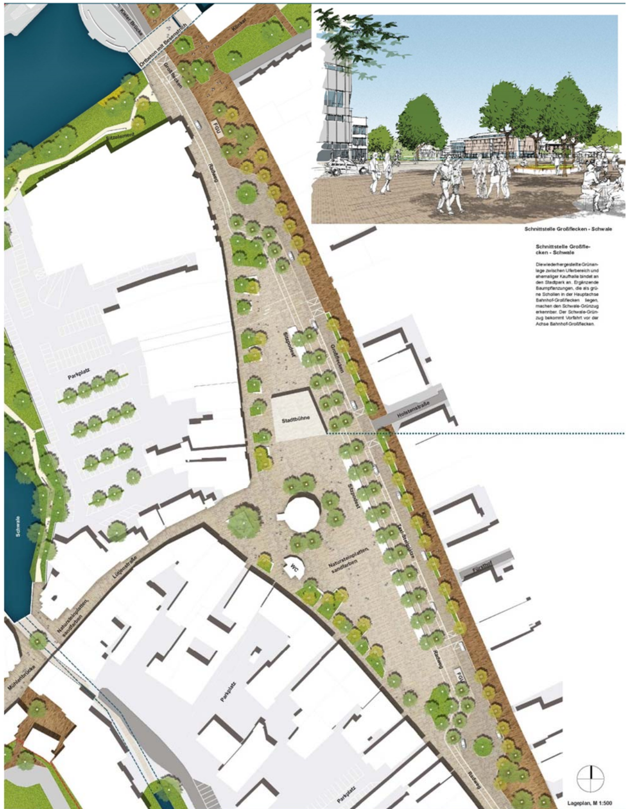
Schnittstelle Großflecken - Schwale